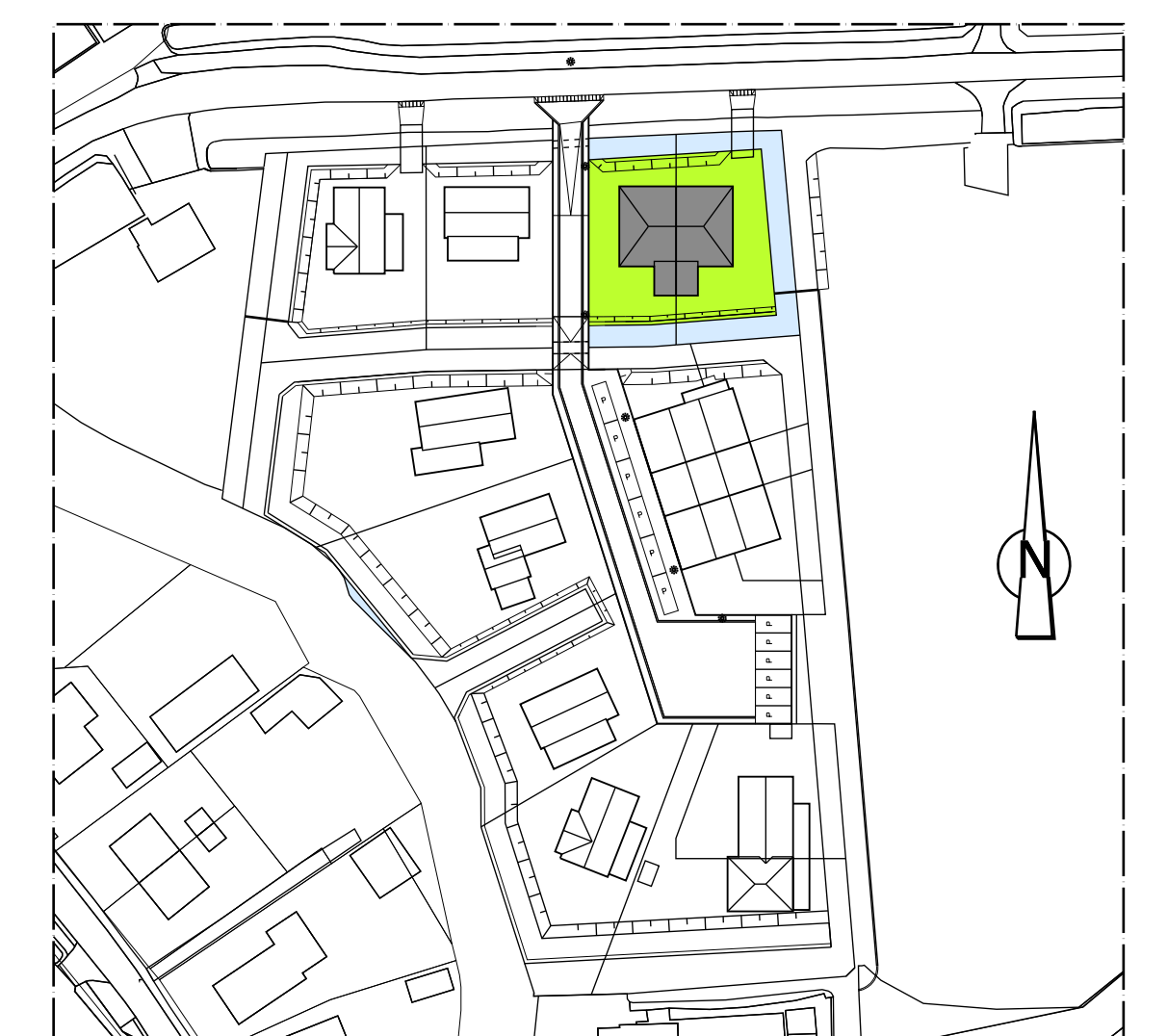
Situatie schaal 1:1000

0 1 2 3 4 5 M schaaltat t.b.v. plattegronden schaal 1:50